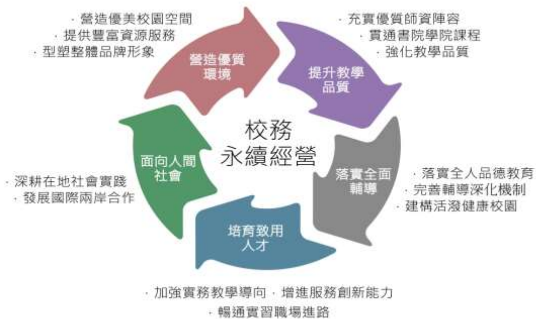
圖 1 109-113 學年度中程校務發展計畫之發展策略

立基於本校的辦學基礎，持續 109-113 學年度中程校務發展計畫，進入第三期程 114-118 學年度中程校務發展計畫的規劃，重點持續書院教育的實踐，更為推展「無疆界大學」計畫，共分為營造優質校園、提升教學品質、落實全面輔導、培育致用人才，以及面向人間社會五大策略主軸，發揚人文與書院精神，實踐大學社會責任，整體校務計畫發展策略如圖所示：